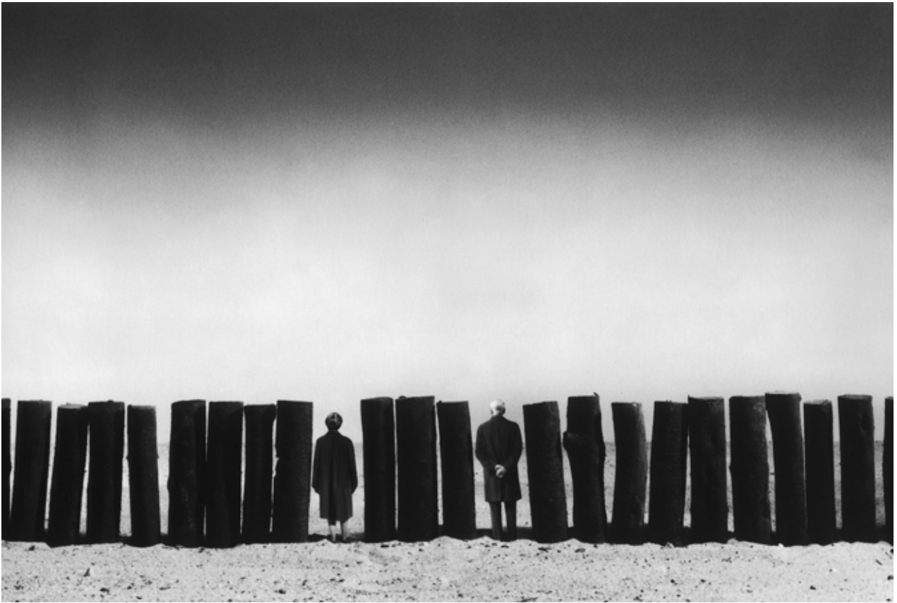
Gilbert Garcin - Se rendre utile .

Gilbert Garcin è ormai molto noto, ha esposto in tutto il mondo e le sue foto sono conservate presso importanti istituzioni pubbliche e private. Nel 2013 Les Rencontres di Arles gli hanno dedicato un'ampia e splendida retrospettiva che abbiamo potuto visitare. Ha pubblicato diversi volumi tra cui il "libretto rosso" Mister G. , edito in Francia da Filigranes e in Italia da Postcart.